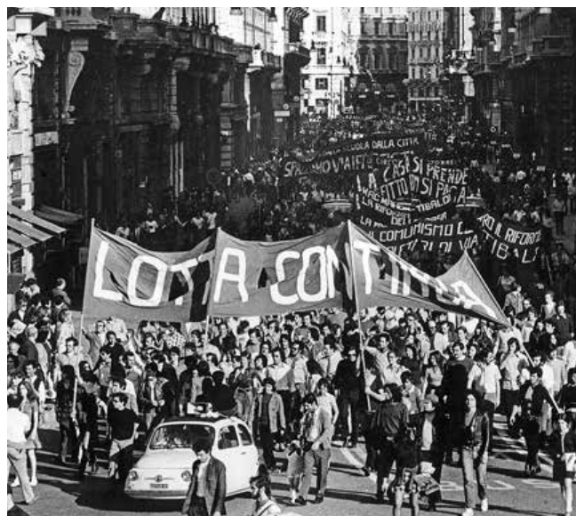
Der Kampf würde immer weitergehen, dachte man damals, bis zum Sieg

„Den Linken gelang die Anpassung an die neuen Verhältnisse nicht“